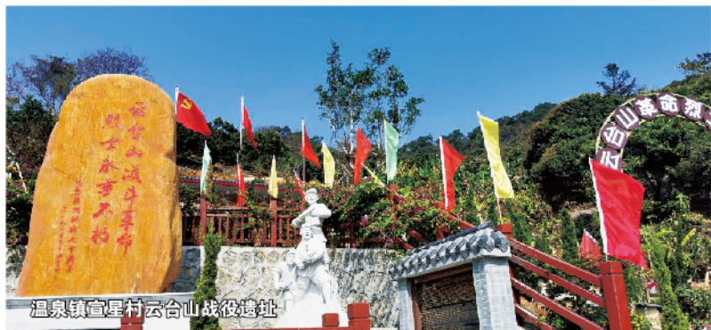
温泉镇宣星村云台山战役遗址

牲的50位战友立下新碑，表崇敬之意，抒缅怀之情。云台山战士的故事不会被人遗忘，他们的革命精神也将世代相传。