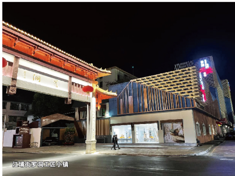
江埔街罗洞工匠小镇

“一纵”（休闲旅游轴）“三区”（综合服务配套区、产业创新发展区与研学体验休闲区）发展布局，擦亮工匠文化旅游新名片。