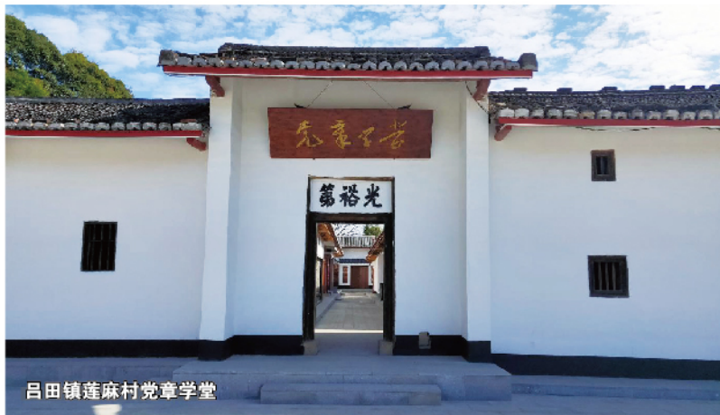
吕田镇莲麻村党章学堂

想，进一步增强“四个意识”、坚定“四个自信”，做到“两个维护”，在推进习近平新时代中国特色社会主义思想在南粤大地落地生根结出丰硕成果的过程中，不忘初心、牢记使命，为实现中华民族伟大复兴的中国梦不懈奋斗！