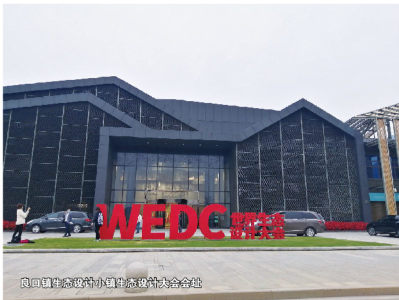
良口镇生态设计小镇生态设计大会会址