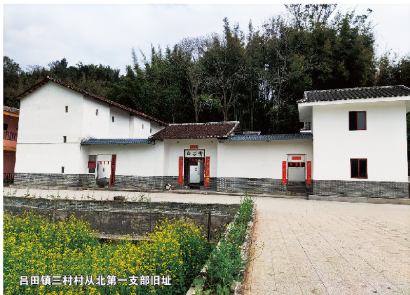
吕田镇三村村从北第一支部旧址

吕田镇莲麻村黄沙坑革命旧址： 曾经是东江纵队从化大队的活动基地、抗日根据地，也是从化县第一任县委书记任命之地。