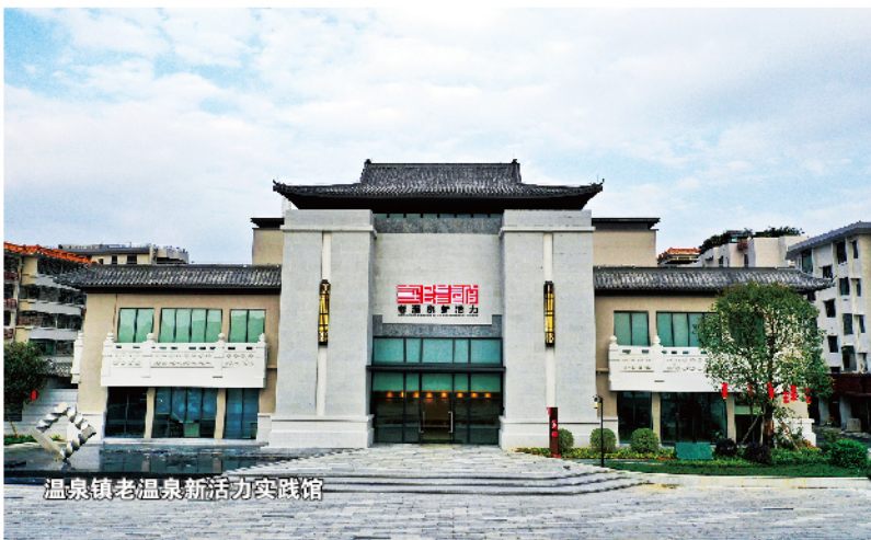
温泉镇老温泉新活力实践馆

创新创业和生态设计等四大主导产业的积极探索；展示了基于生态设计产业五大共性技术打造的“新基建”、“新生态”、“新活力”平台，探索发展人工智能产业新模式，实现“绿水青山”与“金山银山”的价值转换。