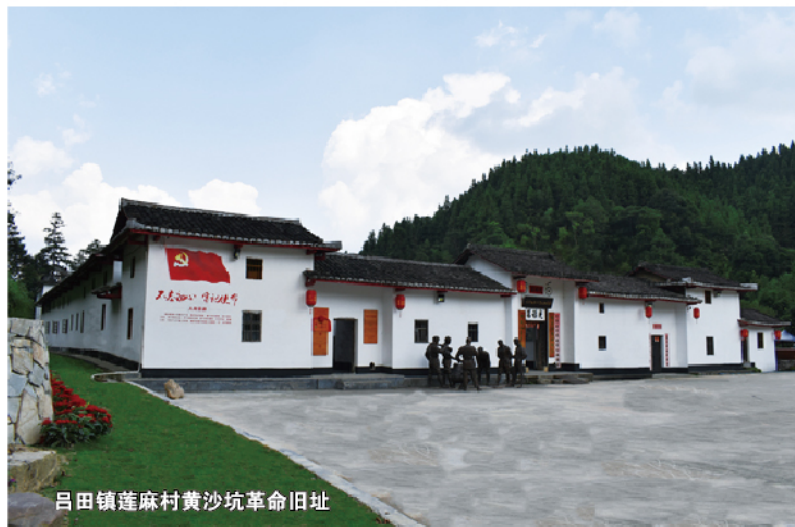
吕田镇莲麻村黄沙坑革命旧址

广州市委党校教育基地、从化区青少年莲麻革命传统教育基地、从化区中小学生综合实践基地、从化区博物馆黄沙坑革命史馆等先后在此揭牌成立。