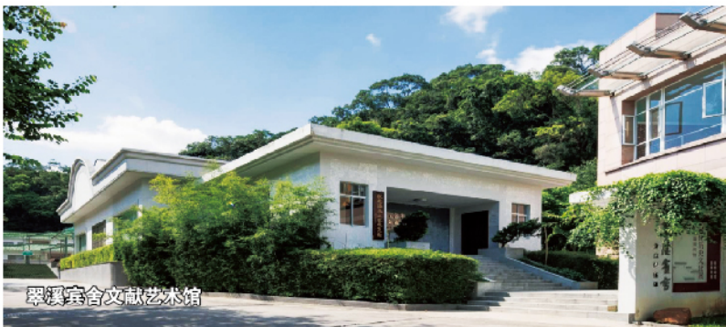
翠溪宾舍文献艺术馆

推荐餐饮： 广东温泉宾馆陶然餐厅/悠然居农庄 推荐住宿： 广东温泉宾馆/亨来斯登温泉酒店/碧泉空中温泉酒店 周边的景点： 温泉财富小镇/石门国家森林公园/南平静修小镇