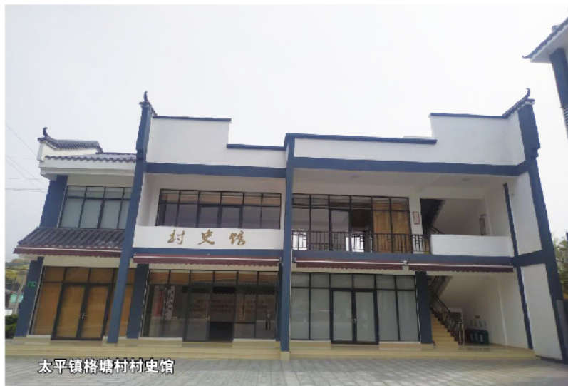
太平镇格塘村村史馆

村史馆前面有一个“不要怕”广场，占地1300平方米，它是为了纪念1978年格塘大队芝麻湖生产队一段敢为人先的历史。