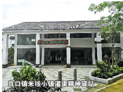
良口镇米埗小镇灌渠精神驿站

七大灌渠是精神之渠，反映从化人民修渠时展现出的主人翁精神、铁肩膀精神、卷裤腿精神、“鸡公车”精神、挑灯战精神和齐上阵精神。灌渠精神属于历史，也属于当前和未来；是从化人民代代传承的文化自信，也是从化加快改革发展的精神家园。