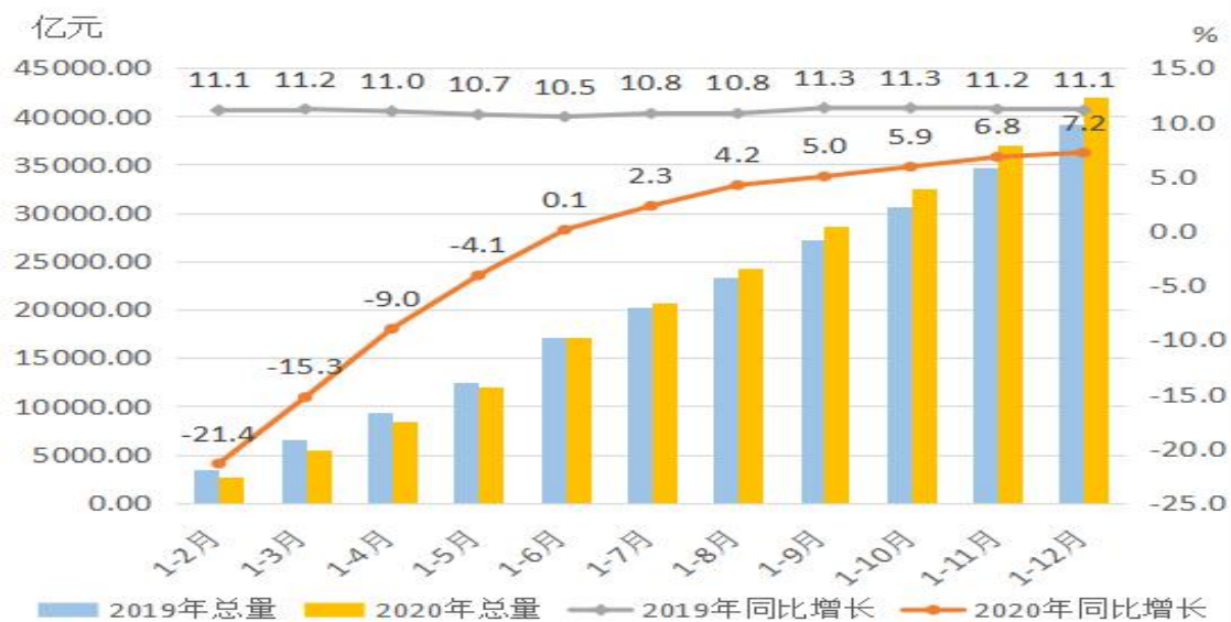
图3 2019年以来广东固定资产投资及增速对比图

2. 市场销售持续回暖，消费升级类商品销售快速增长。2020年，全省社会消费品零售总额40207.85亿元，同比下降6.4%，降幅比前三季度收窄2.9个百分点。城镇市场消费品零售额下降6.3%，降幅小于农村市场0.5个百分点，比前三季度收窄2.9个百分点。商品零售下降4.7%，餐饮收入下降18.7%，降幅分别比前三季度收窄2.5个、6.4个百分点。大宗商品消费好转，汽车类、石油及制品类商品零售分别下降3.8%和21.2%，降幅比前三季度收窄5.8个和0.9个百分点。日常消费类商品零售保持稳定，粮油食品类、饮料类、日用品类、中西药品类分别增长9.4%、14.4%、7.8%和21.6%。消费升级类商品零售增长快于平均水平，金银珠宝类、体育娱乐用品类、书报杂志类、通讯器材类分别增长6.4%、1.5%、25.2%和1.9%。线上消费活跃度提高，全年限额