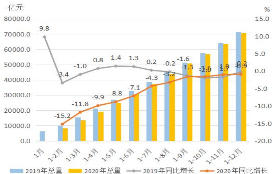
图5 2019年以来广东进出口总额及增速对比图

工业品出口交货值稳步恢复，全年出口交货值 33551.22 亿元，同比下降 3.7%，降幅比前三季度收窄 2.8 个百分点，其中 12 月增长 6.1%，增幅达年内最高。分行业看，全省有出口的 37 个大类行业中，13 个行业正增长，其中烟草制品业、医药制造业、化学纤维制造业、专用设备制造业分别增长 174.0%、111.9%、20.5%和 13.7%。12 月，金属制品业，电气机械和器材制造业，仪器仪表制造业，文教、工美、体育和娱乐用品制造业分别增长 26.5%、18.3%、12.2%和 10.7%。