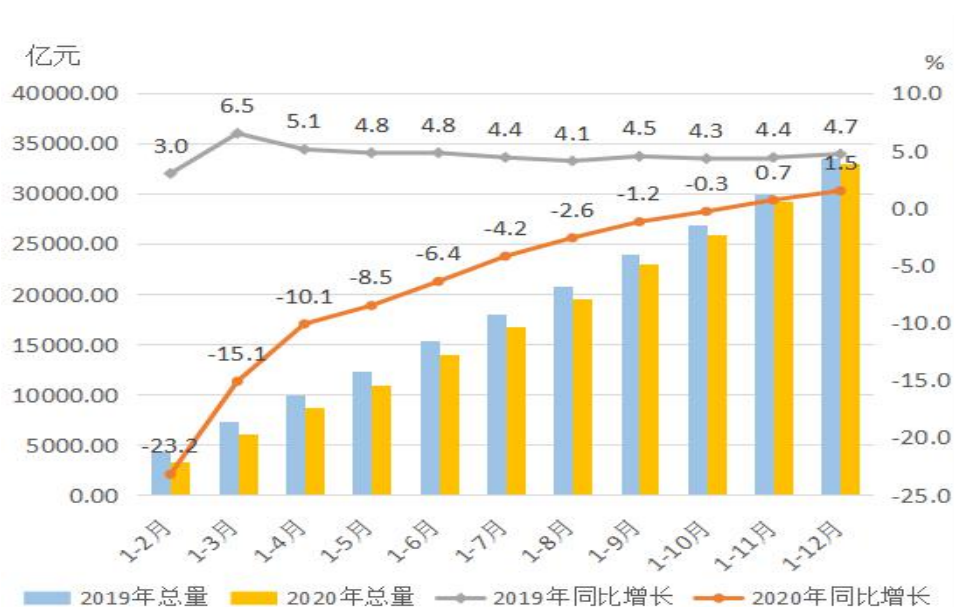
图 2 2019 年以来广东规模以上工业增加值及增速对比图

传统行业稳步恢复，纺织业、造纸和纸制品业分别增长 7.9%、1.9%，增幅高于制造业平均水平 6.6 个和 0.6 个百分点。先进制造业增长 3.4%，占规模以上工业增加值的 56.1%，其中装备制造业增长 1.8%；高技术制造业增长 1.1%，占规模以上工业增加值的 31.1%。全省工业百强企业增加值增长 6.0%，占规模以上工业增加值的 32.3%。防疫物资产量高速增长，全省生产口罩 273.99 亿只，增长 3340.6%，其中医用口罩 156.38 亿只，增长 5458.1%。