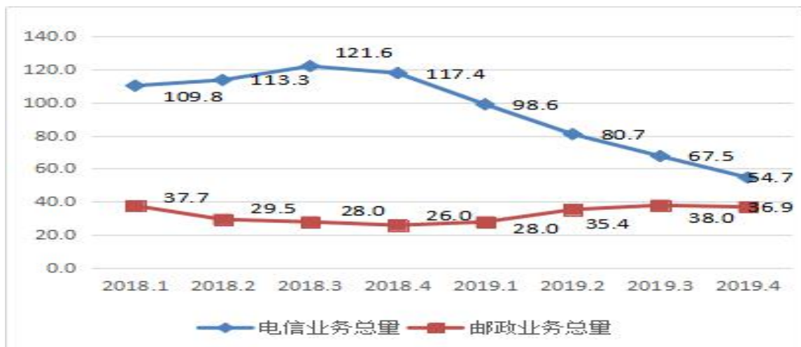
图2 2018年以来广东邮政电信业务量季度累计增幅