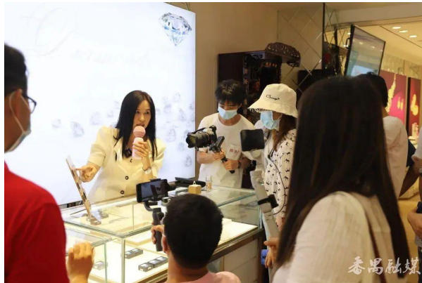
讲解员讲解沙湾珠宝

活动在政企合作特色小镇——番禺区沙湾瑰宝小镇研学点开展。学员们听取讲解员介绍沙湾珠宝产业的历史概况和“政企合作”共建模式，以及观摩珠宝研制的全流程，学员们由衷赞赏依托沙湾珠宝产业园打造的珠宝玉石首饰特色产业基地，感叹其完善的海关、检测、物流等驻园服务和提供审批、合同备案、核销、通关等“一站式”便捷服务。瑰宝小镇“珠宝-文化-旅游”三位一体的产业发展理念，为乡村建设提供了宝贵的特色经验。此研学点活动在线上同步直播，体现番禺分校线上线下同步教学的特色。