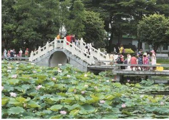
螺涌公园内，游人在桥上观赏荷花。南沙区