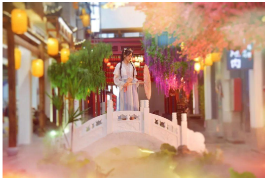
穿汉服小姐姐打卡“上河里国潮街”

活动当天，近 100 位抖音和小红书网络博主到园区进行打卡。现场设有多个游戏摊位，疯狂送豪礼，还有更多好吃好玩的商家优惠活动，不少市民纷纷在现场打卡。