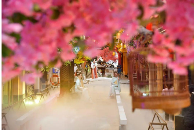
“上河里国潮街”人工河流