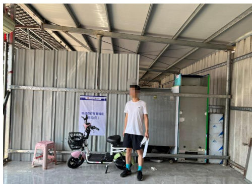
电动自行车查验区