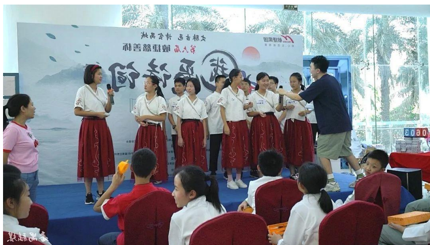
诗词热身赛晋级组答题中

随后，选手们在水晶湖乐园开始进行“水上乐园”活动，本次“水上乐园”活动由“水中拔河”和“捕鱼”大赛两个游戏环节组成。在“水中拔河”游戏中，晋级组分为两队、复活组为一队，共三队，每队 6 人，一齐上阵互相拉动绳子，胜利一方挑战剩下一队，最终决出胜负。