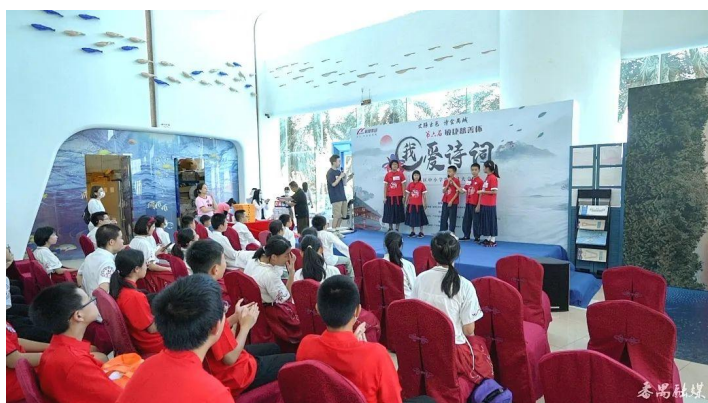
诗词热身赛复活组答题中

在诗词热身赛现场，36 名选手提前体验了部分决赛赛制，为决赛“热身”。在诗词热身赛中，复活组的 6 名选手向晋级组的 12 名选手发起挑战，通过“听诗名，背诗词”“看图猜古诗句”“接龙背诵”等不同的比赛形式，以积分结果决定胜负，得分高的团队获得胜利。经过一番激烈的诗词答题比拼，选手们在团队比赛中共同协作，发挥团队力量，最后，晋级组获得胜利。