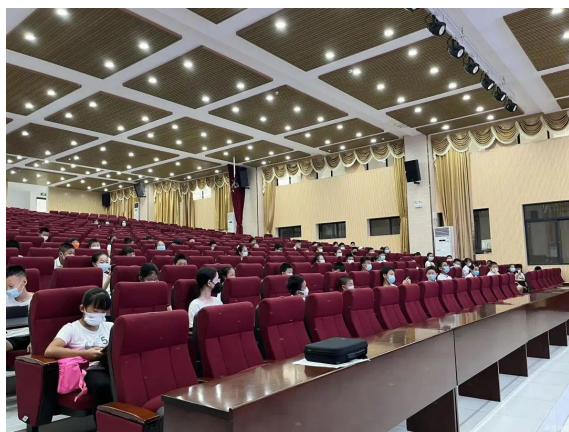
小学组冲击赛晋级选手