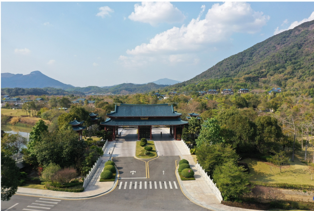
从都国际庄园占地面积280多万平方米，将盛唐建筑精髓与现代化设施、国际化服务融为一体，配套投资达80亿，接待过来自70多个国家的100多位前政要，他们称赞这里为“中国现代庄园的典范”。