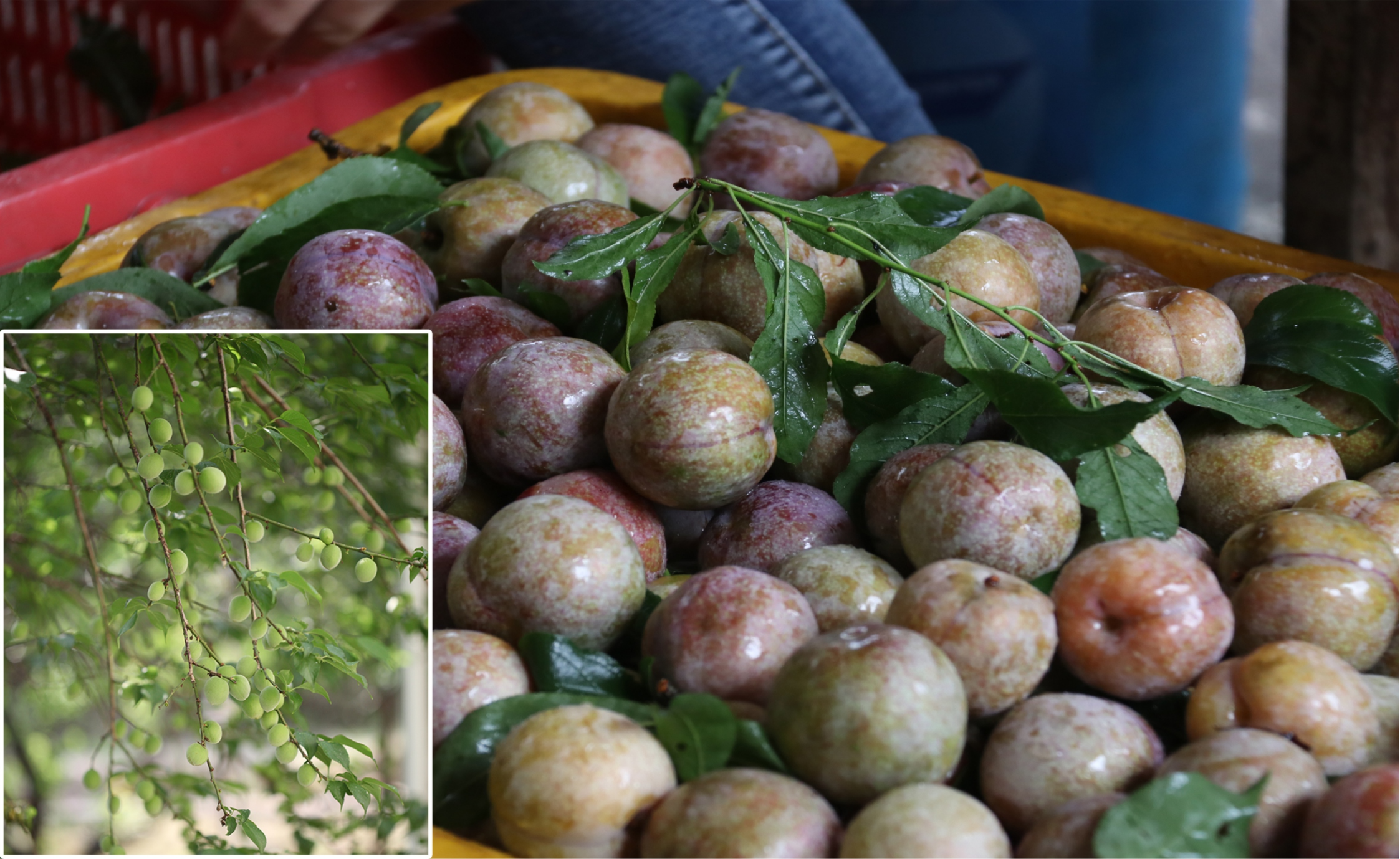
溪头村三华李、磻溪村青梅等也颇有名气，通过电商平台远销省内外。 此外，随着观光农业蓬勃发展，良新村瑶华圃的葡萄、良平村长山埔果桑园的桑葚吸引不少游客慕名前来。