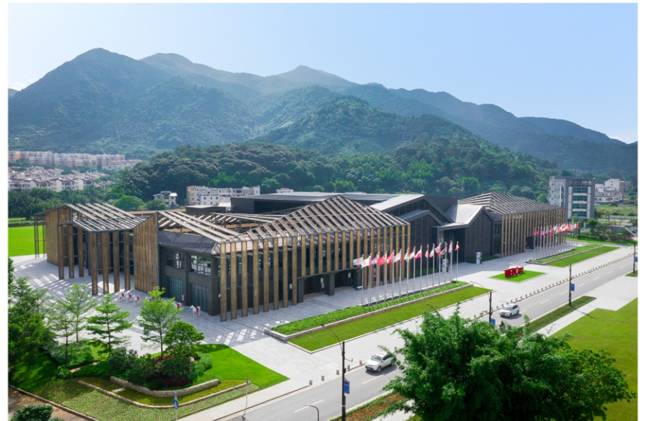
生态设计小镇建设后

生态设计小镇致力于打造宜居宜业宜游的生态绿谷、全国第一个生态设计产业集群、产业、人文、环境三位一体的新发展样本。2018年，从化区仅用89天时间，将良口镇塘尾村一座旧农贸市场改造成为世界生态设计大会永久会址，创造了令人惊叹的“从化速度”。