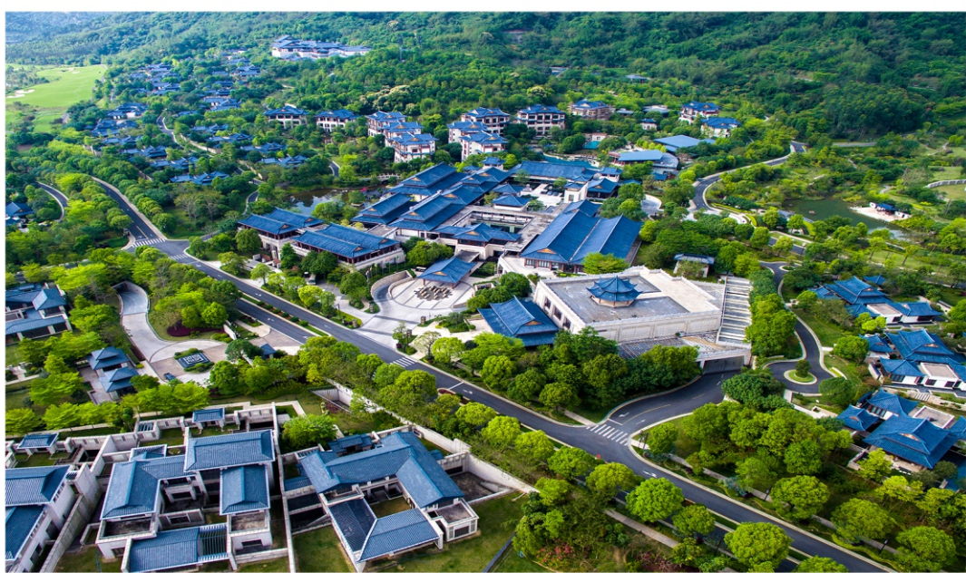
从都国际论坛源于2011年8月的“从都国际峰会”，旨在通过探讨政治、经济和文化等领域的热点话题，增进各方的了解和共识，从而推动区域和全球合作。