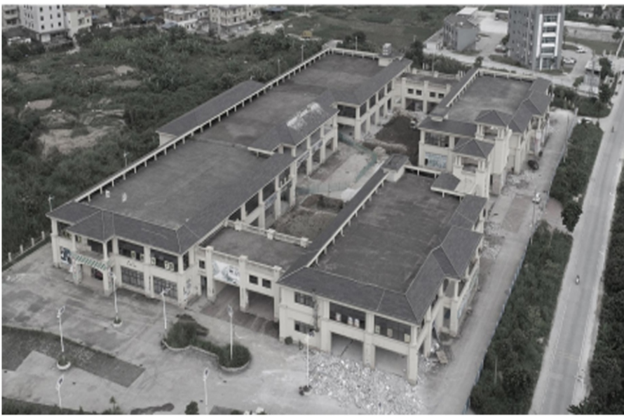
生态设计小镇建设前